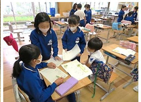
関わり合う子供たち