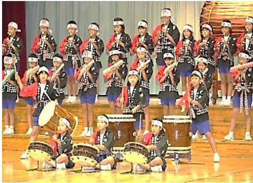
迫力ある4年生の太鼓演奏

1・2・3・6年生は、学習参観で一生懸命に考える様子、友達と関わって学ぶ様子など、それぞれに成長した姿を保護者の方々に見ていただくことができました。