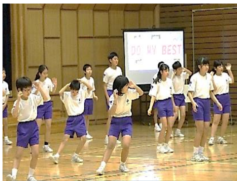
笑顔はじける5年生のダンス