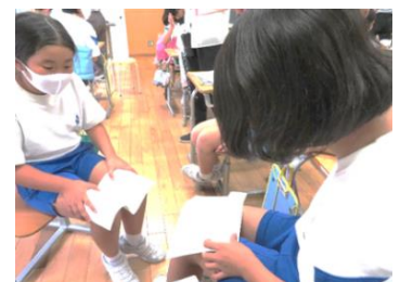
考えを伝え合う子供たち

これからも、友達と関わり合いながら問題を解決する喜びや楽しさを味わいながら、主体的に学んでいくことができるよう、友達の見方・考え方を理解したり新たな視点から考えたりする学び合いの場を大切にした授業づくりを行っていきます。