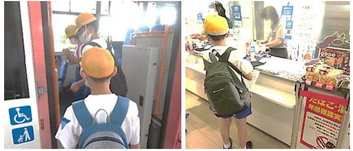
生き生きと体験する子供たち

公共交通機関の利用では、乗車や運賃の支払い方のきまり、車内での公共マナーを守って移動することができました。また、買い物体験では、算数で学習したことを生かし、決められた金額内で買い物を行うことができました。