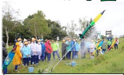
発射の度に大歓声が上がりました！

子供たちは、学校からその姿を望む医王山の自然の中で、仲間と協力して活動することの大切さを知り、これまで以上に友達との絆を深めることができました。「6年生全員が笑顔で、最高の宿泊学習にしたい」という子供たちの思いが形となった宿泊学習となりました。2学期のさらなる成長が楽しみです。