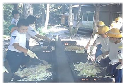
【おいしい焼きそばを作ろう！】

待ちに待った宿泊学習。5年生にとって初めての宿泊学習でした。期待をもち、目を輝かせて準備を進めてきた子供たち。コロナウイルス感染症の影響で実施が心配されていましたが、無事に一泊二日を終わられたことをとてもうれしく感じます。