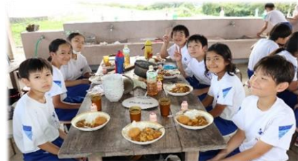
班員全員で協力し、美味しいカレーが出来上がりました！