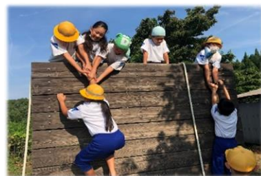
【作戦を立て、協力して登ろう！】

野外炊飯、キャンプファイヤー、イニシアティブゲーム等の活動を通して、時間を守ることや協力することの大切さに気付くことができました。イニシアティブゲームのウォールという課題では、全員が高い壁を登りきるために、順番や作戦を考えて挑みました。声をかけ合って協力する姿が見られ、一層仲間との絆が深まったように感じます。これからも仲間を大切に、高学年としての更なる成長を願っています。